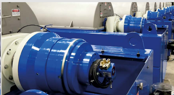
Increased decanter performance and improved separation results thanks to the hydrostatic ROTODIFF drive. Erhöhte Dekanter-Leistung und verbesserte Trennergebnisse dank dem hydrostatischen ROTODIFF Antrieb.