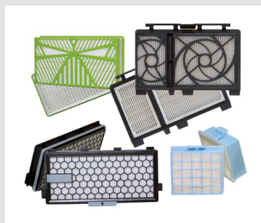
HEPA Filter mini-pleat

Unter unserer Marke CLEAN OFFICE fertigen und vertreiben wir Feinstaubfilter für Laserdrucker.