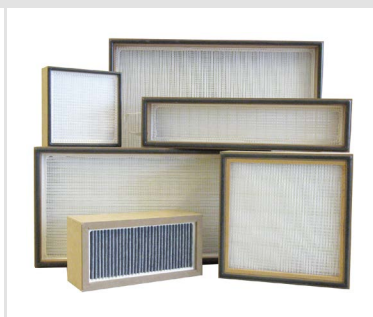
HEPA Filter mit MDF-Rahmen