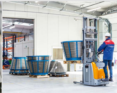
Wedge wire centrifuge baskets