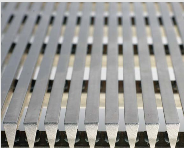
Pro-SLOT® wedge wire screens and tubes

Wir konzentrieren uns vor allem auf Produktivitätsgewinne, Kostensenkung, Verbesserung der Qualität und Kundenbetreuung. Unsere Erzeugnisse stellen wir in 3 Werken in Polen her und liefern in über 60 Länder in fünf Kontinenten. Wir bedienen Weltkonzerne und kleinere Firmen in einer Branche von: Kohlenbergbau, Raffinerie und Petrochemie, Mineralaufbereitung, Nahrungsmittel, Brauereien- und Zuckerindustrie, Wasser-aufbereitung und Abwasseraufbereitung.