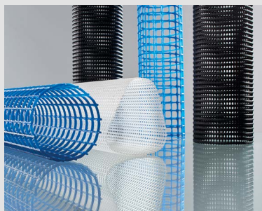
Cores and Cages Gitterrohre

Zusätzlich wird ein breites Produktprogramm an Füllkörpern für die Gaswäsche, biologische Abwasserbehandlung und Prozesswasserkühlung hergestellt. Egal ob Standard oder kundenspezifische Anforderungen – wir beraten und betreuen unsere Kunden weltweit und sichern durch regelmäßige Audits die Qualität unserer Produkte entsprechend der Industriestandards ISO 9001, ISO 14001 und OHSAS 18001.