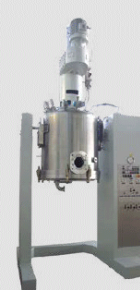
Wega® EFT filter dryer / Wega®EFT Filtertrockner