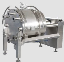
Orion® CDG filter press with sliding vessel / Orion® CDG Filterpresse mit Schiebebehälter