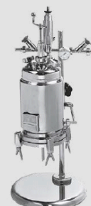
Merkur® FE laboratory filter / Merkur® FE Laborfilter