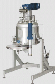
Merkur® EFA/EFD single-layer filter / Merkur® EFA/EFD Einschichtenfilter

• Single-layer filter that can be swivelled for use as a vacuum dryer • Model: EFT with area up to 1.9 m 2 • Optional vessel jacket and bottom that can be heated and cooled, available in special materials