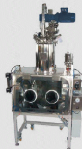
Terra® EFR nutsche filter Terra® EFR Filternutsche