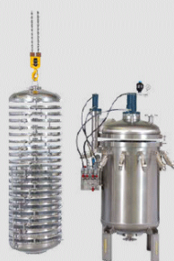
Radium® RZA/RZB horizontal plate filter / Radium® RZA/RZB Horizontalplattenfilter