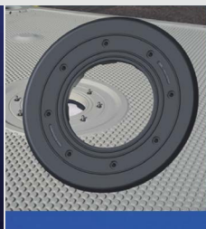
JVK SNAP-FIT Non destructive and screwless „SNAP“ connection. Quick-and-easy to mount – quick-and-easy to remove.