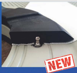
SALA/LASTA FILTER PLATES JVK mining filter plates with special feed systems & replaceable wear parts.