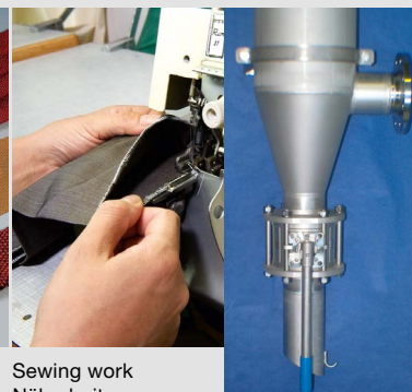
Sewing work Näharbeiten