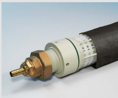
Seamless filtering bag Nahtlos-Filterschlauch

Wir entwickeln kundenspezifische Anwendungen und fördern Neuentwicklungen mit zukunftsversprechenden Rohmaterialien. Dadurch können wir auch anspruchsvollen Kunden einen hohen Qualitätsstandard bieten. Unsere Rohprodukte bestehen hauptsächlich aus Kevlar, Zylon, Glas, PPS, PVDF, PP, BW, PES, PEEK, Viskose, Coregarne und Metallfäden.