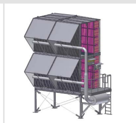
Static Filter System