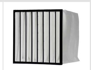
MultiSack N85 vital Taschenfilter