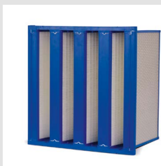
MultiForm Premium Kompaktfilter