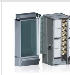
Rotary Oil Bed Filter System