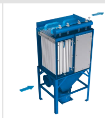
MultiJet Dust Collector