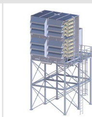
Pulse Jet Filter System