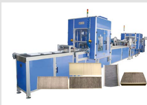
Cabin Filter Line Innenraumfilterlinien

Innenraumfilterlinien, Luftfilterproduktionslinien, Minipleat-Linien, Plisseefilterlinien, Rotations-Faltlinien, Ölfilterlinien, Spulenfilterlinien, Streckmetalllinien, HEPA-Filterlinien, Montagezellen