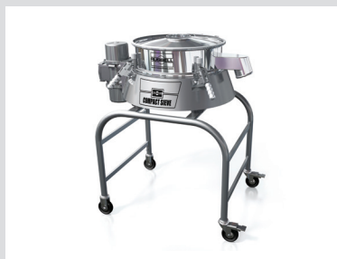
The vibrating Russell Compact Sieve® / Die Russell Compact Vibrations-siebmaschine

Russell Finex ist Weltmarktführer in feinmaschiger Separationstechnologie, mit innovativer Denkweise und Fachkompetenz für ein breites Angebot an Sieb- und Filtrationstechnik.