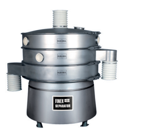
The Finex Separator™ for grading wet or dry materials / Der Finex Separator™ für Siebung von Flüssigkeiten oder Schüttgütern