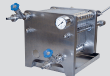
Orion® Pilot Z