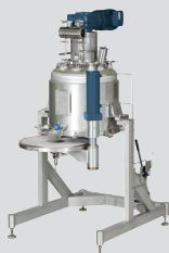
Merkur® EFA/EFD single-layer filter / Merkur® EFA/EFD Einschichtenfilter

• Single-layer filter that can be swivelled for use as a vacuum dryer • Model: EFT with area up to 1.9 m 2 • Optional vessel jacket and bottom that can be heated and cooled, available in special materials