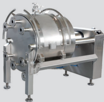
Orion® CDG filter press with sliding vessel / Orion® CDG Filterpresse mit Schiebebehälter