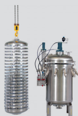
Radium® RZA/RZB horizontal plate filter / Radium® RZA/RZB Horizontalplattenfilter