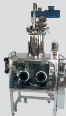
Terra® EFR nutsche filter Terra® EFR Filternutsche