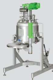
merkur® Einschichten- filter in 8 Baugrößen