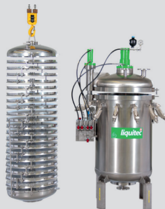
radium® Plattenfilter in 3 Baugrößen