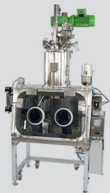
terra® Filtertrockner mit integrierter „Glovebox“