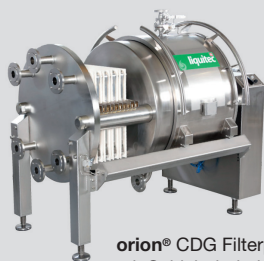
orion® CDG Filterpresse mit Schiebebehälter (geschlossenes System in 2 Baugrößen)