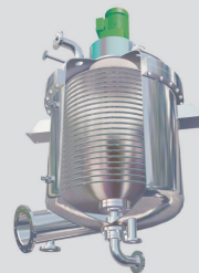
disc® Zentrifugalplattenfilter bis 60 m 2 Fläche und Zentrifugal-Kuchenabwurf