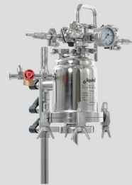
merkur® Einschichtenfilter – Laborfilter in 3 Baugrößen