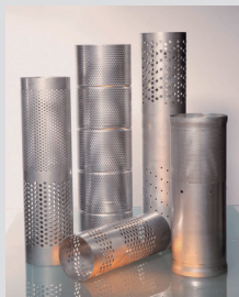
Tubes for sound absorbers / Rohre für Schalldämpfung

• Filterrohre und Stützkörper in allen Materialien und Varianten • Ø7mm – Ø3000mm • Längen von 3mm – 15000mm • Drahtgewebeerarbeitung • Baugruppenmontage für Filterkunden sowie Kleinteilfertigung für Automotive, Elektronik, Medizintechnik • Kleinserien, Prototypen 0...500.000 Stk. • Komplexe Bauteile incl. Schweißkonstruktionen (EN 1090; DIN 2303)