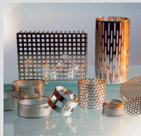
Various units of perforated plate / Diverse Bauteile aus Lochblech