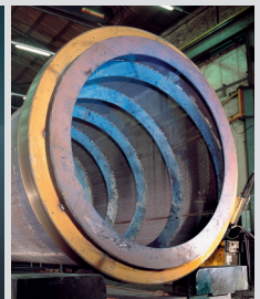
Drum including race and conveying screw / Trommel mit Laufringen und Förderschnecken