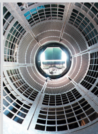
Screening and sorting drum / Sieb- und Sortiertrommel