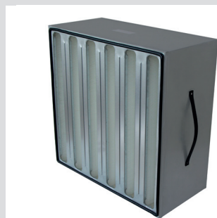
V Bank HEPA

Meltblown-Filtermedien von Filterklasse G4 – F9 (Rollenware oder als Filtertaschen) Glasfaser Filtertaschen Metallgewirk Lamine für Z-Line Filter Non-Woven Polyester Filter als Rollenware in Filterklasse G2 – F6 Glasfaser Medien für Lackieranlagen Filter und Filtermedien aus Aktivkohle Filterpakete für Z-Line Filter Minipleat Packs HEPA Filter Kunststoffrahmen für Kompaktfilter Kunststoffrahmen für Taschenfilter und Paneelfilter