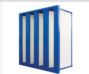
Aero Cell V