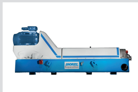
Decanter centrifuge Dekanterzentrifuge

ANDRITZ S.A.S. verfügt über die Erfahrung und das Know-how, ihre Kunden bei den täglichen Herausforderungen in der Trenntechnik zu unterstützen.