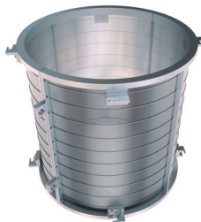
Mill insert for separating auxiliary substances from the ground substance Mühleneinsatz für Trennung von Hilfsstoffen vom Mahlgut